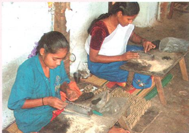
ONDERDEEL VAN DE BEDRIJFSVOERING VAN MCC ZIJN GOEDE BANEN VOOR VROUWEN UIT DE OMGEVING. ZE KRIJGEN MEER DAN HET PLAATSELIJKE MINIMUMLOON.